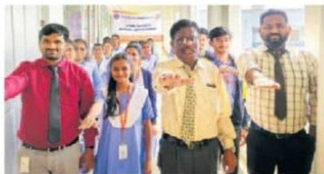
ఆదిత్యలో ప్రతిజ్ఞ చేస్తున్న ద్వుళ్ళు

గండేపల్లి, నవంబరు 21 (ఆంధ్రజ్యోతి): మండలంలోని నూరంపాలెంలో ఆదిత్య డిగ్రీ, పిజి కళాశాలలో ఫోరెన్సిక్ సైన్స్ విభాగం, ఎన్.ఎస్.ఎస్ ఆధ్వర్యంలో సంబంధ హెల్త్ ఫౌండేషన్(ఎస్ హెచ్ఎఫ్) సహకారంతో ఆంధ్రప్రదేశ్ స్టేట్ కౌన్సిల్ ఆఫ్ హయ్యర్ ఎడ్యుకేషన్ ప్రారంభించిన డ్రగ్ ఫ్రీ ఆంధ్రప్రదేశ్ కార్యక్రమం నిర్వహించారు. వ్యాసరచన పోటీలు నిర్వహించి డ్రగ్స్ ప్రభావాలపై అవగాహన పెంచడానికి ప్రతిజ్ఞ చేశారు.